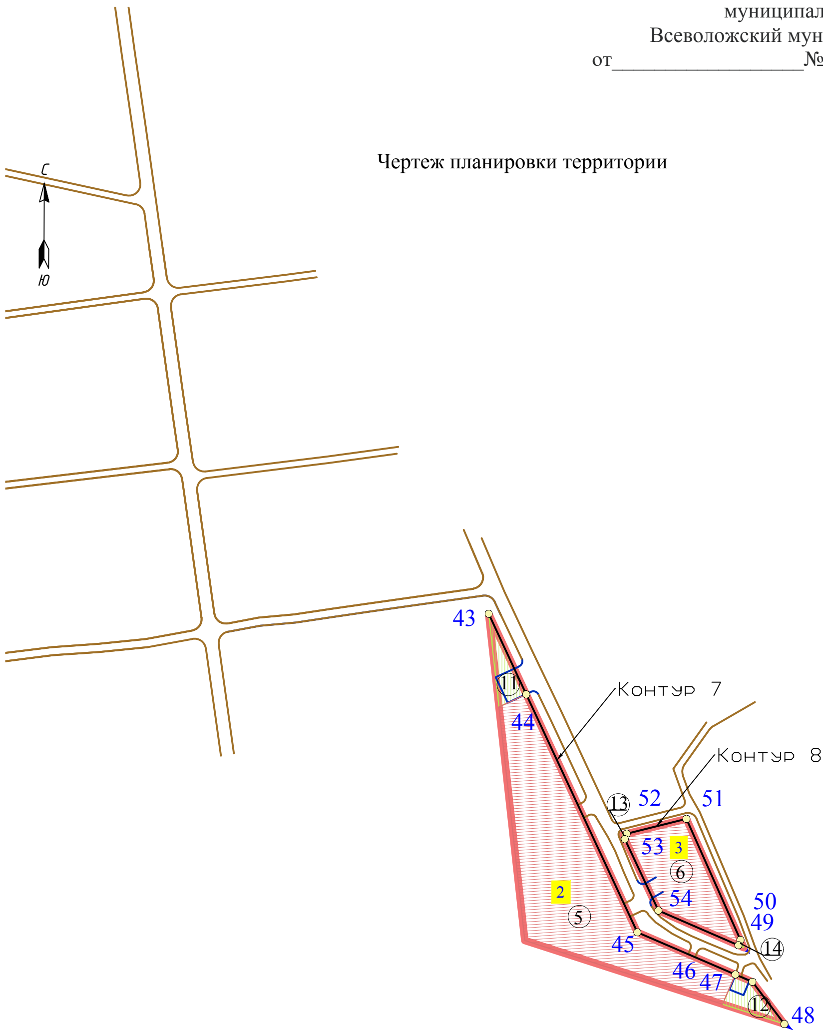
Чертеж планировки территории